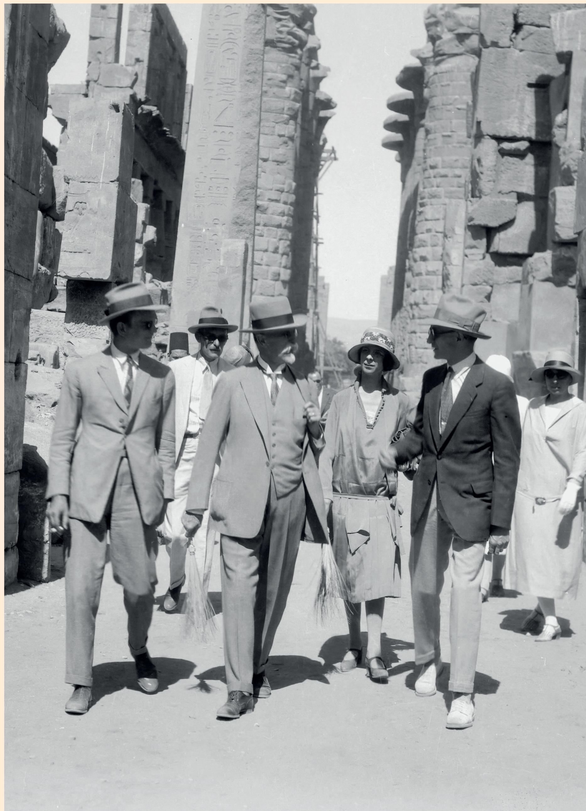
Prezident Tomáš G. Masaryk s doprovodem a s egyptologem Jaroslavem Černým v Luxorském chrámu, 1927.

The exhibition was organised: by the Masaryk Institute and Archives of the CAS, v. v. i., and Centre of Administration and Operations of the CAS, v. v. i., in cooperation with the Library of the CAS, v. v. i., and Museum of Czech Literature