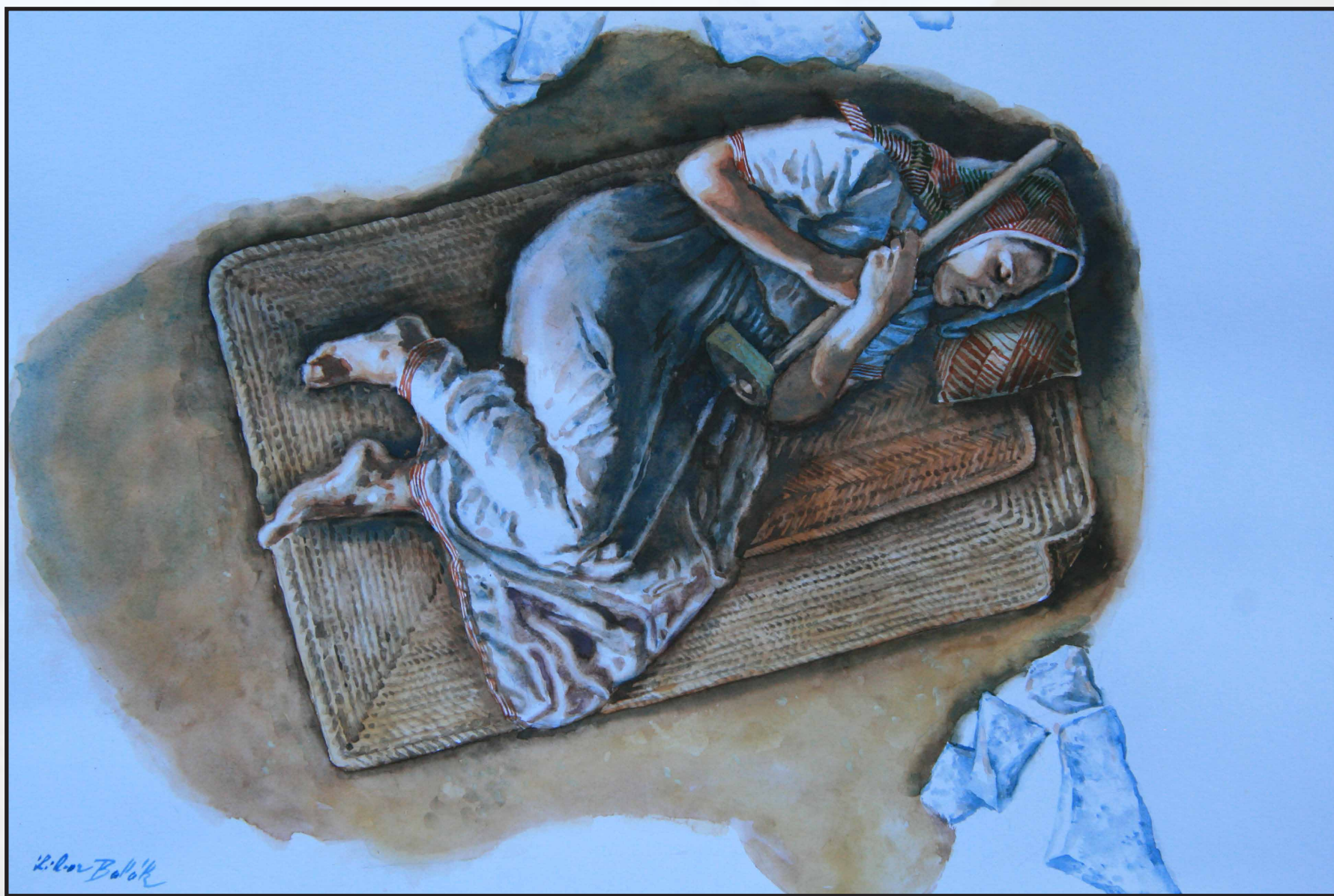
Rekonstrukce pohřbu ženy v sídlištní jámě na hradisku u Hlinska na Přerovsku (pozdní doba kamenná). Ve výbavě kamenný sekeromlat (Drechsler, Šebela 2016).

Rentgenový snímek dokumentující nasazení lebky na páteř. Zdeformované krční obratle (C1 a C2) jsou zakryty horní čelistí se zuby.