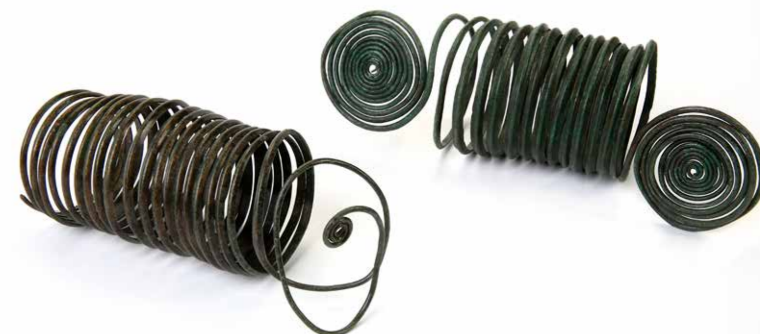
Bronzové nápažníky z hromadného nálezu v areálu Hradiska. Depot o hmotnosti 40 kg obsahoval stovky šperků, zbraně, nářadí a měděnou surovinu v podobě zlomků ingotů.