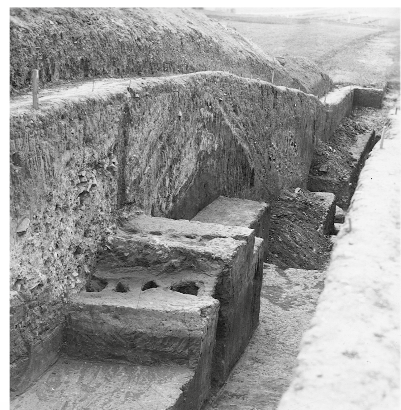
Řez opevněním (výzkum dr. Spurného v l. 1949-56).

Charakteristická keramika střední doby bronzové ze starších výzkumů (16. - 14. stol. př. n. l.).