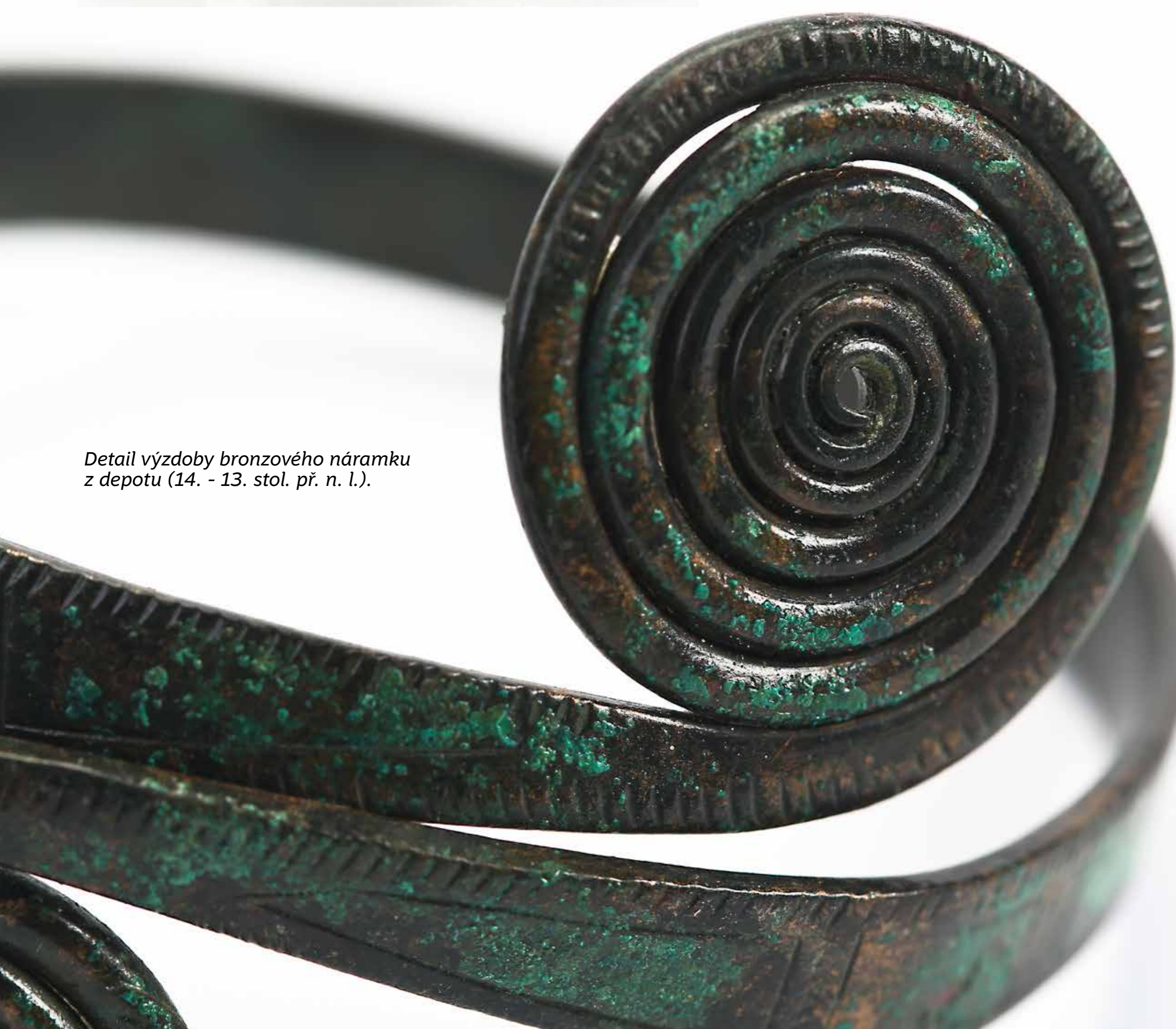
Detail výzdoby bronzového náramku z depotu (14. - 13. stol. př. n. l.).