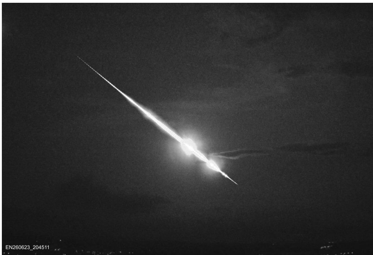
Obrázek 2. Složený snímek bolidu EN260623_204511 z videozáznamu pořízeného videokamerou na observatoři v Ondřejově.