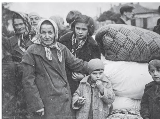
Uprchlíci po Mnichovské dohodě v Terezíně