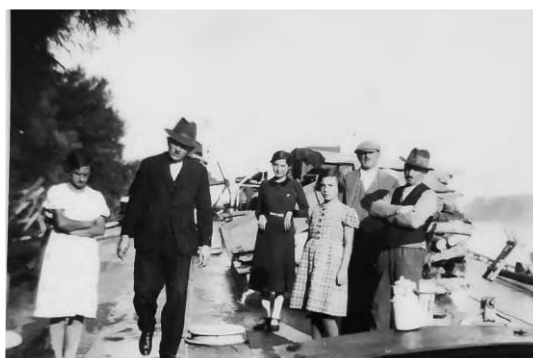
Uprchlíci z Burgenlandu na vlečné lodi na Dunaji.