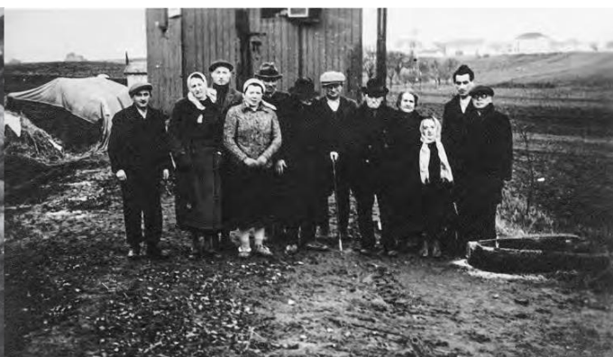
Uprchlíci v zemi nikoho na demarkační čáře u města Louňy